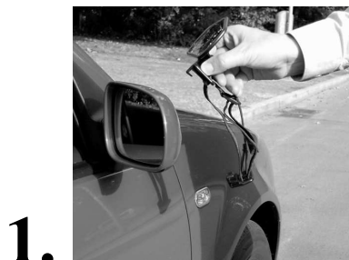
1. Hall spegeln som bilden visar.