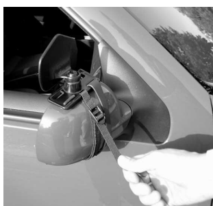
4. Dra at tygremmen ordentligt.