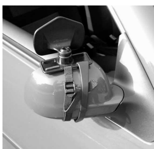
5. Fast tygremmen under gummibandet.