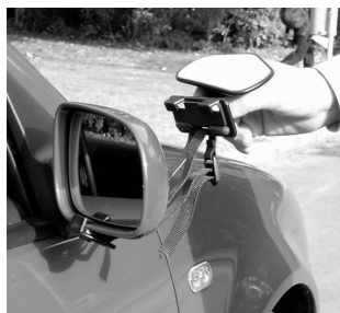
2. Spänn fast spegeln undertill.