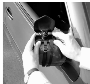
3. Spänn först nu fast själva spegeln ovanpå. Vid första användningen ställ in längden på gummibandet.