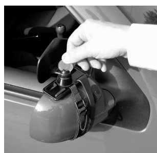
6. Med hjälp av ett större mynt kan sedan spegeln regleras i passande läge och därefter fixeras.